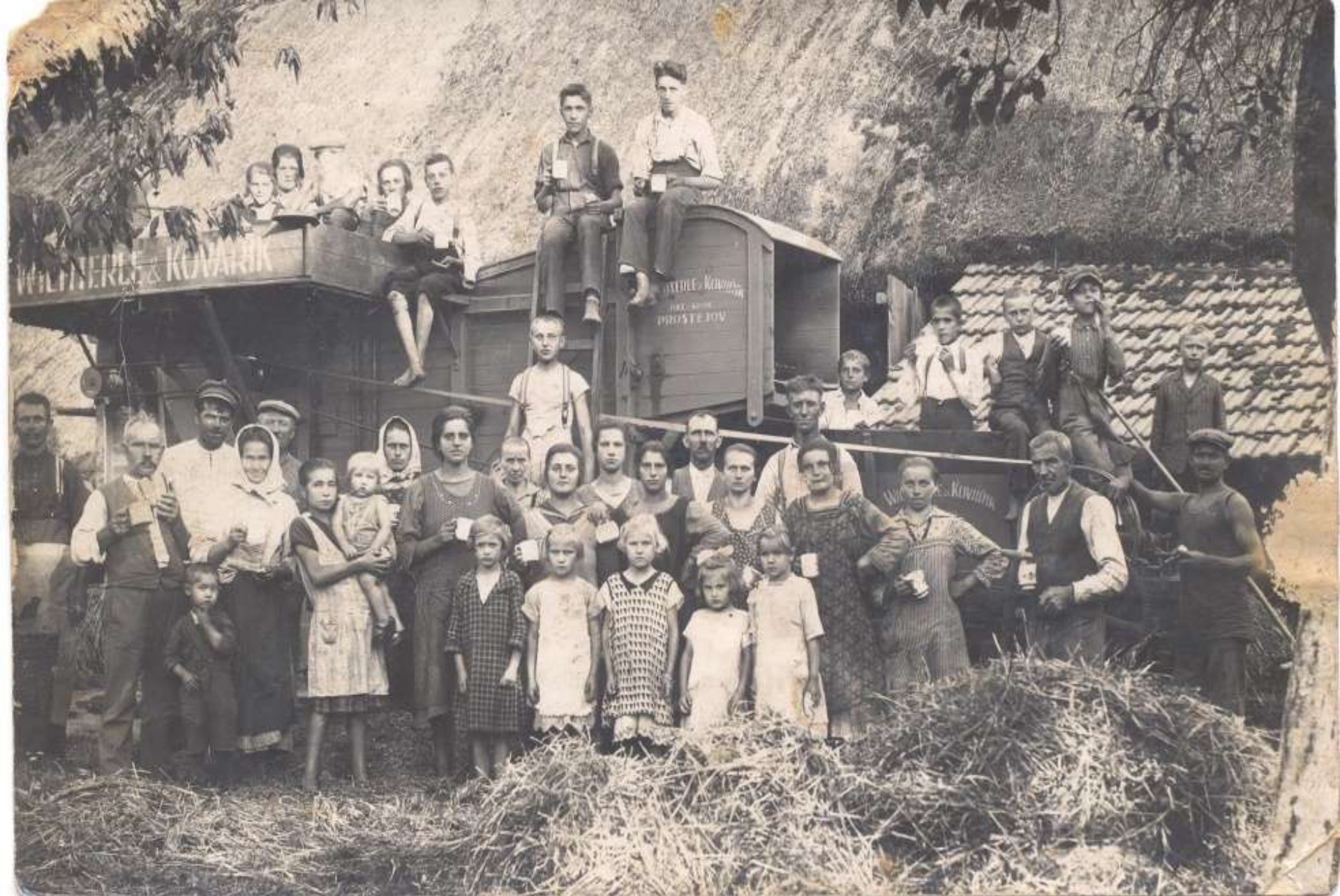
Mláčení obilí u Smýkalů č.21