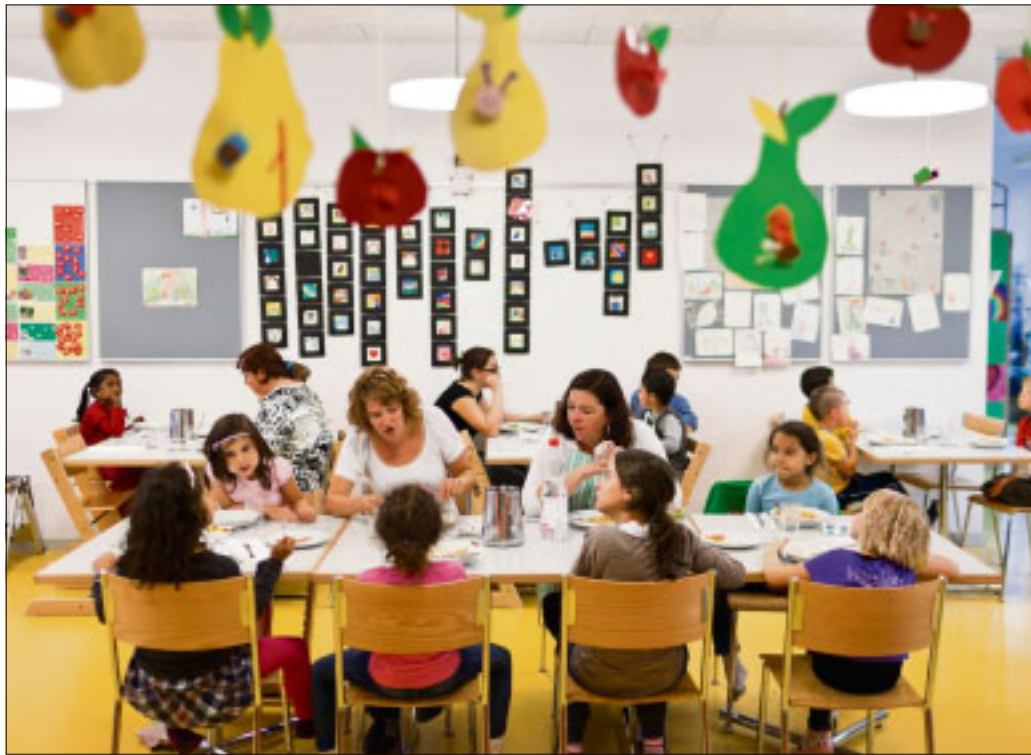
Betreuungsplätze für Kleinkinder sind sowohl in Tschechien als auch in Deutschland Mangelware.

Alternativen für Frauen, die trotz Kleinkindern wieder früher an ihren Arbeitsplatz zurückkehren möchten, sind noch immer spärlich gesät: An der Situation nach 1990, als im Zuge der politischen Neuordnung etliche Kinderbetreuungseinrichtungen mangels staatlicher Unterstützung geschlossen wurden, hat sich seither wenig geändert. „Früher gab es hier um die Ecke gleich fünf staatliche Kinderkrippen, wo ich die Kleinen hinschicken konnte – heute gibt es noch eine, und die ist privat“, stellt eine Mutter aus dem Prager Stadtteil Vinohrady fest, deren Kinder in den 1980ern aufwuchsen. Arbeits- und Sozialminister Jaromír Drábek (TOP 09) hat das Problem erkannt. Wie sein Ministerium errechnete, gehen in Tschechien lediglich 36 Prozent der Frauen mit Kindern unter sechs Jahren einer beruflichen